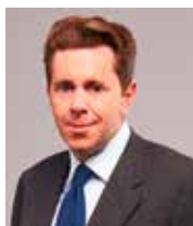
Harald Mahrer, Staatssekretär

„Wir stehen vor der größten Umbruchphase seit der industriellen Revolution. Bildung, Digitalisierung und Innovation in der Wirtschaft sind entscheidende Faktoren am Weg zu mehr Wettbewerbsfähigkeit. Die Herausforderungen der letzten Jahre haben deutlich gezeigt, dass Länder und Regionen mit einer intakten und starken industriellen Basis stürmische Zeiten besser gemeistert haben als andere. Die Industrie ist damit unlegbar ein wesentlicher Motor von Wachstum, Export- und Innovationsleistung sowie Beschäftigung und Wohlstand. Von ihr gehen starke Übertragungseffekte auf andere Sektoren aus und nach wie vor sind es die Unternehmen, die große Summen in Innovationen, sowohl auf Produkt- als auch auf Fertigungsebene, investieren. Um Weiterentwicklung und Wachstum des produzierenden Bereichs auch in Zukunft voranzutreiben, braucht es wettbewerbsfähige Rahmenbedingungen und eine aktive Industrie- und Standortpolitik. Unser klares Ziel ist es, Innovation zu stärken, um Österreich wieder zum Innovation-Leader zu machen.“