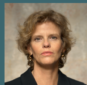
Dr. Sabine Haag, GD des Kunsthistorischen Museums

„Ich sehe Kunst als Inspiration und der Zugang dazu soll einem möglichst breiten Publikum offen stehen.“