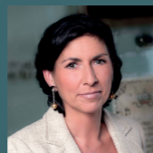
Dr. Danielle Spera Direktorin Jüdisches Museum Wien

„Unser Ziel ist es, neben Ausstellungsprojekten auch einen Einblick in das heutige jüdische Leben in Wien zu geben.“